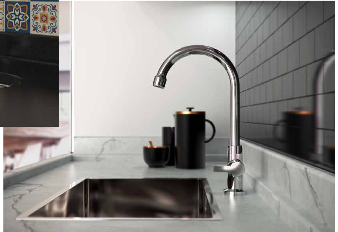
VISTA DO PRODUTO APLICADO.